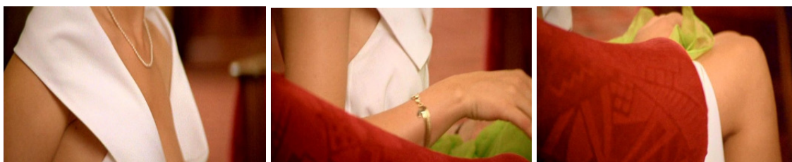
دوربین از سر او آغاز می‌کند تا گردن و دستهایش می‌رود و عاقبت به جانب پاهایش می‌گردد.

در این فیلم صحنه‌ای هست که در آن این زن در سالن هتل نشسته است. دوربین از سر او آغاز می‌کند تا گردن و دستهایش می‌رود و عاقبت به جانب پاهایش می‌گردد. در این زمان به قول لورا مول وی داستان فیلم معلق می‌ماند و فیلم مجذوب تن این زن می‌شود. 2