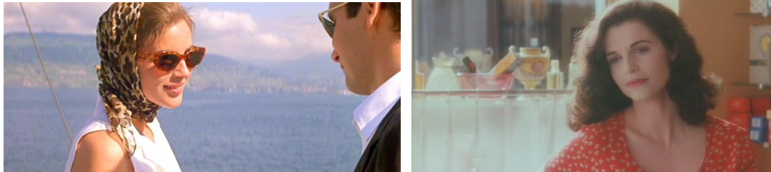
حضور زنهای زیبا در فیلم‌های پاتریس لوکنت Left: Le Parfum d'Yvonne ; right: Le mari de la coiffeuse

لورا مول وی می‌گوید که حضور جسمی و جنسی زن جزئی اساسی در ترکیب فیلم‌های جامعه مردسالاری است. و از این نتیجه می‌گیرد که زنی که چنین فیلم‌هایی را ببیند یا اسیر چنین جامعه‌ای است و یا از چنین تصویرهایی لذت مازوخیستی میبرد.