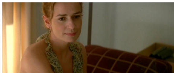
ساندرین بونر 4 در فیلم رازگویی‌های بسیار نزدیک در این فیلم نیز دوربین دور سر و گردن این زن می‌چرخد. بنا بر نظر لورا مول وی، داستان فیلم را حضور جسمی و جنسی این زن‌ها منجمد می‌کند.

البته این صحنه از فیلم عطر ایوون تنها مورد حرکت دوربین پاتریس لوکننت بر روی بدن زن‌ها نیست. در فیلم رازگویی‌های بسیار نزدیک 3 دوربین این فیلمساز دور سر و گردن این زن می‌گردد و در آن مکث می‌کند.